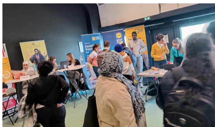
Forum « Village de l'emploi – Sillon de Bretagne, Saint-Herblain », Avril 2024, organisé par l'Atdec Nantes Métropole