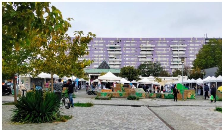
Forum « Village de l'emploi – Dervallières, Nantes », Septembre 2023, organisé par l'Atdec Nantes Métropole